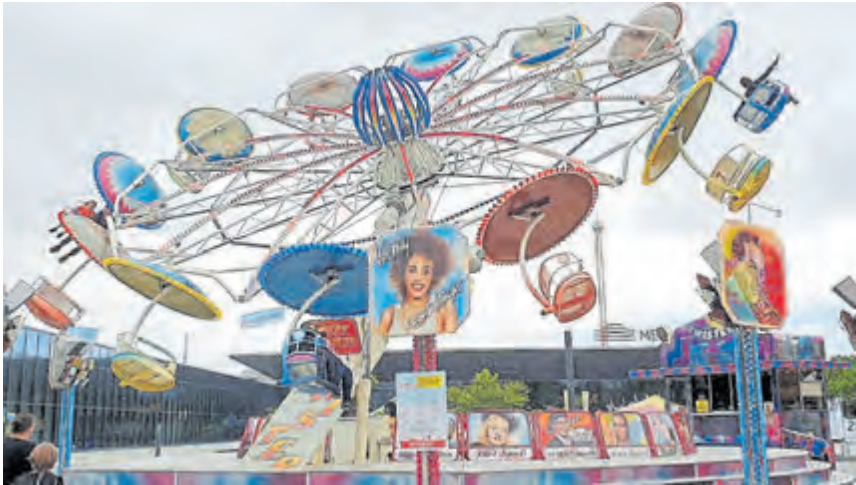
Hoch hinaus geht es für Kirmesfans im Twister.