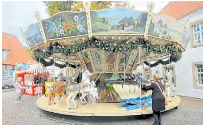
Längst zum Wahrzeichen der Hopstener Kirmes geworden ist das nostalgische Pferdchenkarussell.

die Interessengemeinschaft Kirmesfreu(n)de, wieder einen Schausteller mit dem Musik-Express gewonnen zu haben. Auch der Twister und „Quarter Tramp“ werden nach langer Zeit alle Hopstener zu Adrenalinflügen verleiten. Darüber hinaus freuen sich der Auto Scooter, Babyflug, Devil Dance und das Pferdchenkarussell auf zahlreiche Besucherinnen und Besucher. Die ortsan-