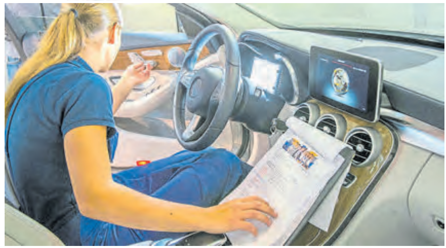
Ausbildungsberufe in der Kraftfahrzeugbranche bieten jungen Menschen gute Entwicklungschancen und zukunftssichere Arbeitsplätze.

Entwicklungen neue Chancen. Tatsächlich stehen Berufe rund um Fahrzeuge und Mobilität hoch im Kurs, berichtet das Deutsche Kfz-Gewerbe. Alleine 2022 haben sich mehr als 25.000 junge Menschen für einen Karriereestieg in der Kraftfahrzeugbranche entschieden. Bei Männern liegt das Berufsbild Kfz-Mechatroniker auf Platz 1 der beliebtesten Ausbildungsberufe, Frauen zieht es verstärkt zur Automobilkauffrau – sie gehört zu den zehn begehrtesten Berufen. Gründe