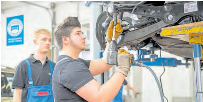
Kfz-Mechatroniker ist der beliebteste Ausbildungsberuf bei jungen Männern.

der zur Suche nach Ausbildungsplätzen. Auch die Karrierechancen durch Spezialisierungen und Höherqualifizierung werden beleuchtet. Zweijährige Weiterbildungen eröffnen zum Beispiel Wege zum geprüften Kfz-Service-Techniker, Automobil-Verkäufer oder -Serviceberater. Über den klassischen Kfz-Meister sind Aufstiege zum Werkstattmanager oder Betriebsleiter möglich, und natürlich erlaubt der Meisterbrief die Übernahme oder Gründung eines eigenen Betriebs. Wer noch mehr erreichen will, kann auch akademische Abschlüsse etwa bis zum Bachelor oder Master of Business Administration in technischen und kaufmännischen Studiengängen anstreben. (djd)