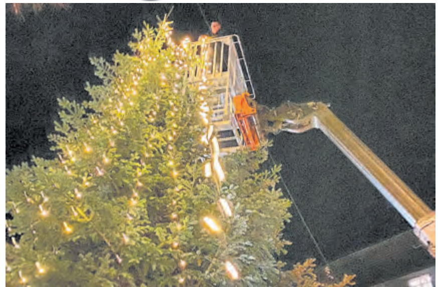
Um den Weihnachtsbaum auf dem Marktplatz zu schmücken, brauchen die Mitglieder der WGH einen Teleskopklader.

Hopsten. Bürgerinnen und Bürger haben die Möglichkeit, im persönlichen Gespräch mit dem Bürgermeister ihre Wünsche und Anregungen vorzubringen. Terminvereinbarung unter ☎ 0 54 58/93 25 11.