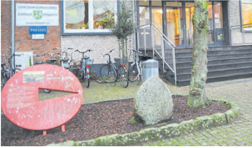
Die Pinne und der Stein vor den Hopstener Rathaus sind Geschenke aus der Partnerstadt Lychen. Beiden hat der Zahn der Zeit zugesetzt und sie werden nun saniert.