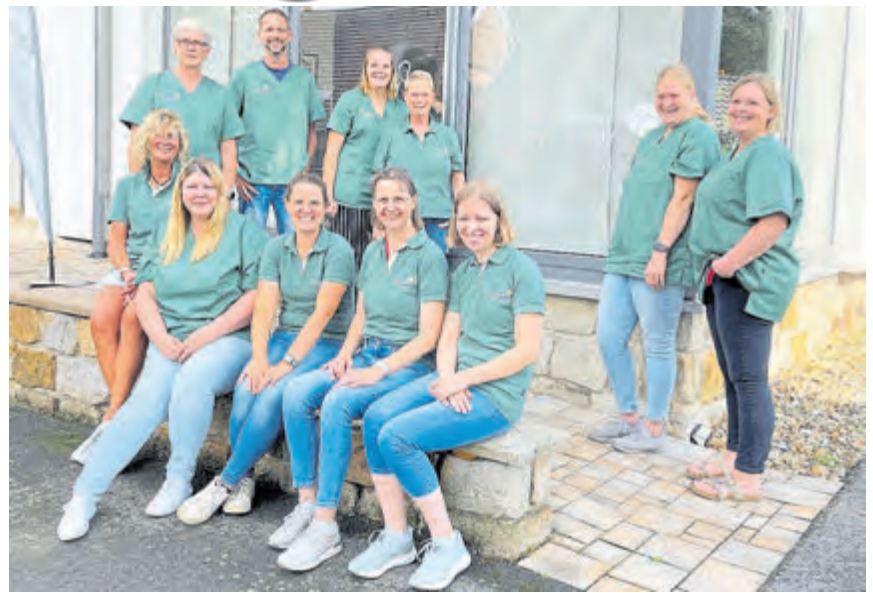
Der neue Pflegedienst „Zuhause“ hat sich nach einem Jahr in Hopsten etabliert. Auf dem Foto ist ein Teil vom Team Hopsten zu sehen.

Auch in der Pflege selbst geht der ambulante Pflegedienst neue Wege. Die Zusammenarbeit mit den Angehörigen steht dabei im Mittelpunkt. Aber auch die Einbindung digitaler Möglichkeiten wird genutzt. Der Pflegedienst arbeitet dafür mit dem Start-Up-Unternehmen „enna“ zusammen. Die Technik ist dabei denkbar einfach: Über ein Tablet mit