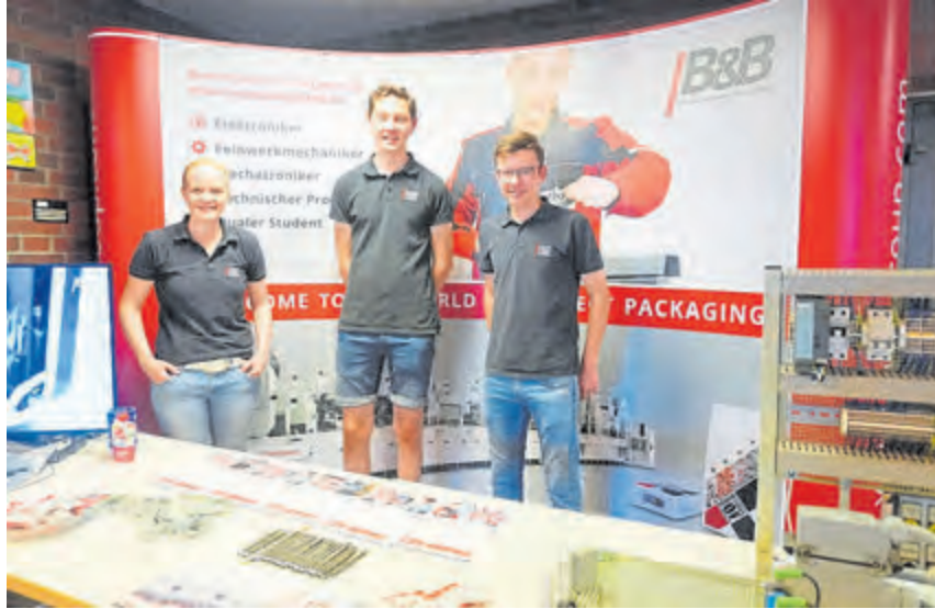
Eine begehrte Anlaufstelle auf der Ausbildungsplatzbörse im Hopstener Schulzentrum war der Stand von B&B Verpackungstechnik.

Neben diesen klassischen Ausbildungsberufen wurden auch duale Studiengänge vorgestellt, die praxisorientiertes Arbeiten im Unternehmen mit einer akademischen Ausbildung kombinieren. Interessierte Schüler*innen erhielten Einblicke in die Studiengänge Wirtschaftsingenieurwesen und nachhaltige Entwicklung, ETS Mechatronik und ETS Elektrotechnik.