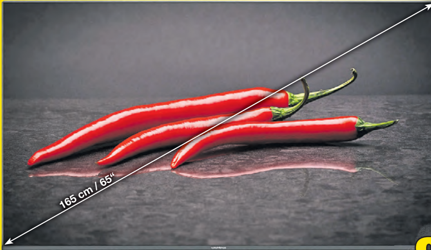
WEGAVISION 65 B