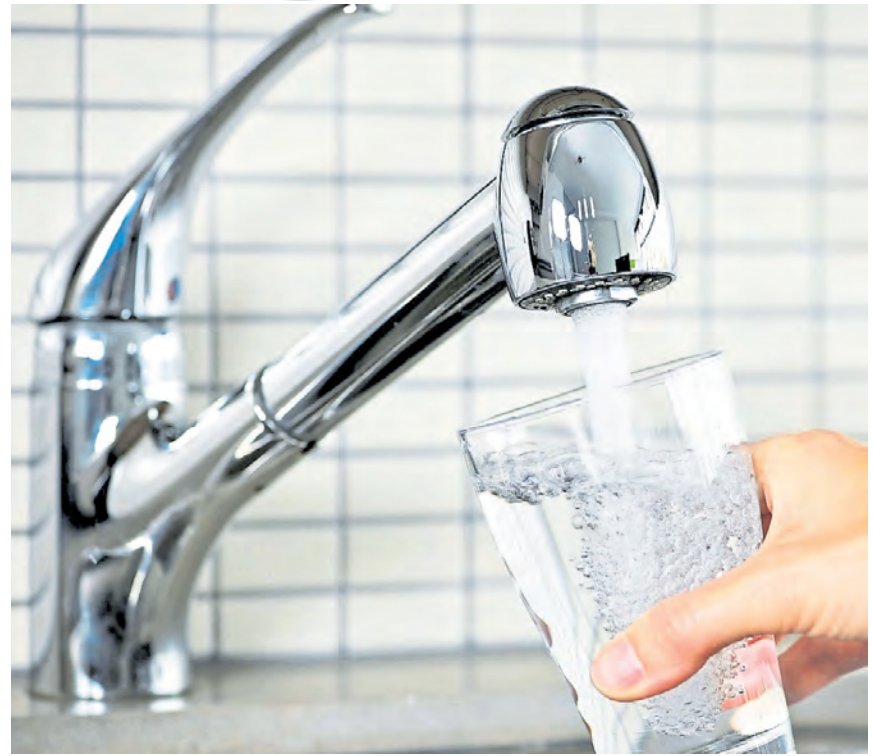
Das Leitungswasser hat in Deutschland eine sehr gute Qualität.