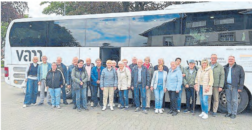
Die Pfarrcaritas hat Kirchenmitglieder über 80 Jahre zu einer Bustour eingeladen.

Im Anschluss an die Rundreise wurden alle ins Kettelerhaus zu Kaffee und Kuchen eingeladen.