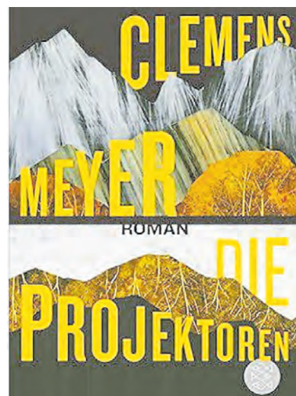
Der Roman „Die Projektoren“ von Clemens Meyer.

Von Leipzig bis Belgrad, von der DDR bis zur Volksrepublik Jugoslawien, vom Leinwandspektakel bis zum Abenteuerroman. ‚Die Projektoren‘ erzählt von unserer an der Vergangenheit zerschellenden Gegenwart – und von unvergleichlichen Figuren: Im Velebit-Gebirge erlebt ein ehemaliger Partisan die abenteuerlichen Dreharbeiten der Winnetou-Filme. Jahrzehnte später finden an genau diesen Orten die brutalen Kämpfe der Jugoslawienkriege statt – mittendrin eine Gruppe junger Rechtsradikaler aus Dortmund, die die Sinnlosigkeit ihrer Ideologie erleben muss. Und in Leipzig werden bei einer Konferenz in einer psychiatrischen Klinik die Texte eines ehemaligen Patienten diskutiert: Wie gelang es ihm, spurlos zu verschwinden? Konnte er die Zukunft voraussagen? Und was verbind-