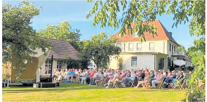
Die Wald- und Wiesenbühne lädt zu Kulturgenuss unter freiem Himmel ein. Am 30. August wird sie auf dem Breischen in Hopsten aufgebaut.

Auf dem Kapellenplatz in Hopsten-Breischen sind alle eingeladen, es sich unter großen Bäumen und Sonnenschirmen mit eigenem Picknick gemütlich zu machen und schönen Geschichten zu lauschen.