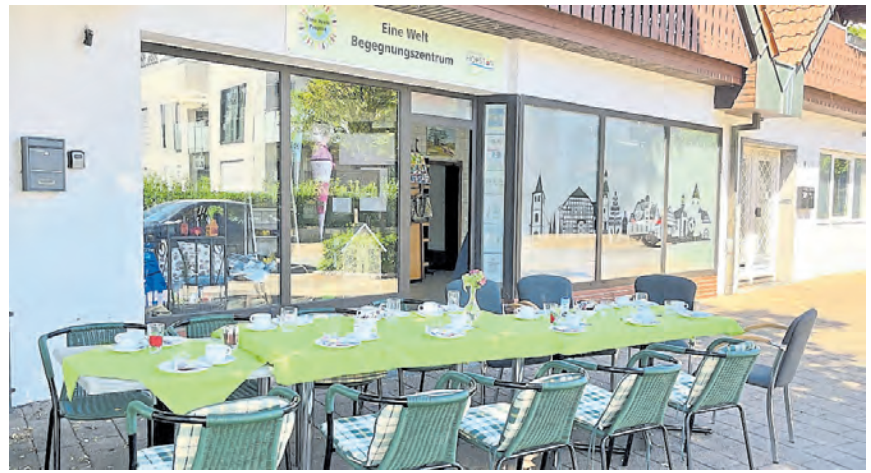
Das Team des Eine-Welt-Shops öffnet seine Türen und lädt alle Interessierten an die (Fairtrade-)Kaffeetafel.