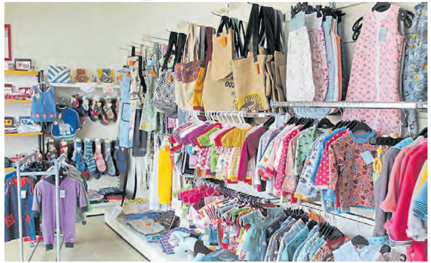
In den Regalen findet sich das gewohnte Sortiment, ob Kaffee, Schokolade, Figuren oder Babykleidung.

Dazu hat der Shop nun ein großes Lager im ehemaligen Kühlraum der Fleischerei. Damit hat das Eine-Welt-Projekt nicht nur mehr Platz