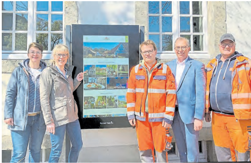
Seit Mitte März informiert ein digitales Infoterminal die Bevölkerung und Gäste am Eingang des Bürgerhauses Veerkamp.

Die Bedienung des Terminals ist denkbar einfach, denn das übersichtliche Layout und die einfache Menüführung sind sehr benutzerfreundlich. Die Informationen, die durch einen Fingertipp auf dem 49-