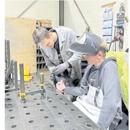
Bei Josef Jasper Behälterbau in Hopsten gab es Einblicke in die Schweißtechnik.

Zukunft bleibe die Berufsorientierung an der St.-Georg-Hauptschule ein wichtiger Bestandteil: Die nächs-