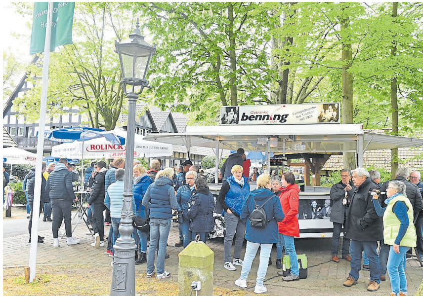
Der „Tag der offenen Tür“ am Heimathaus auf Hof Holling (hier ein Bild aus dem Jahr 2022) am 1. Mai wird anlässlich des Jubiläums in diesem Jahr besonders groß gefeiert.

■ 8. März: Treffen des Fachbereiches „Wander- und Radwandern“