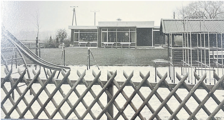
Spielplatz des Kindergartens in Schale vor 50 Jahren.