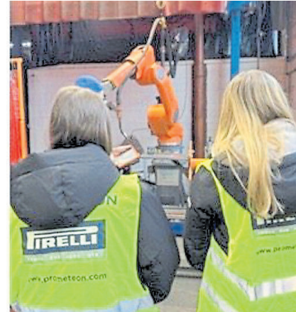
In Schale lernten die Schüler die Firma Kock & Sohn Räder GmbH kennen.