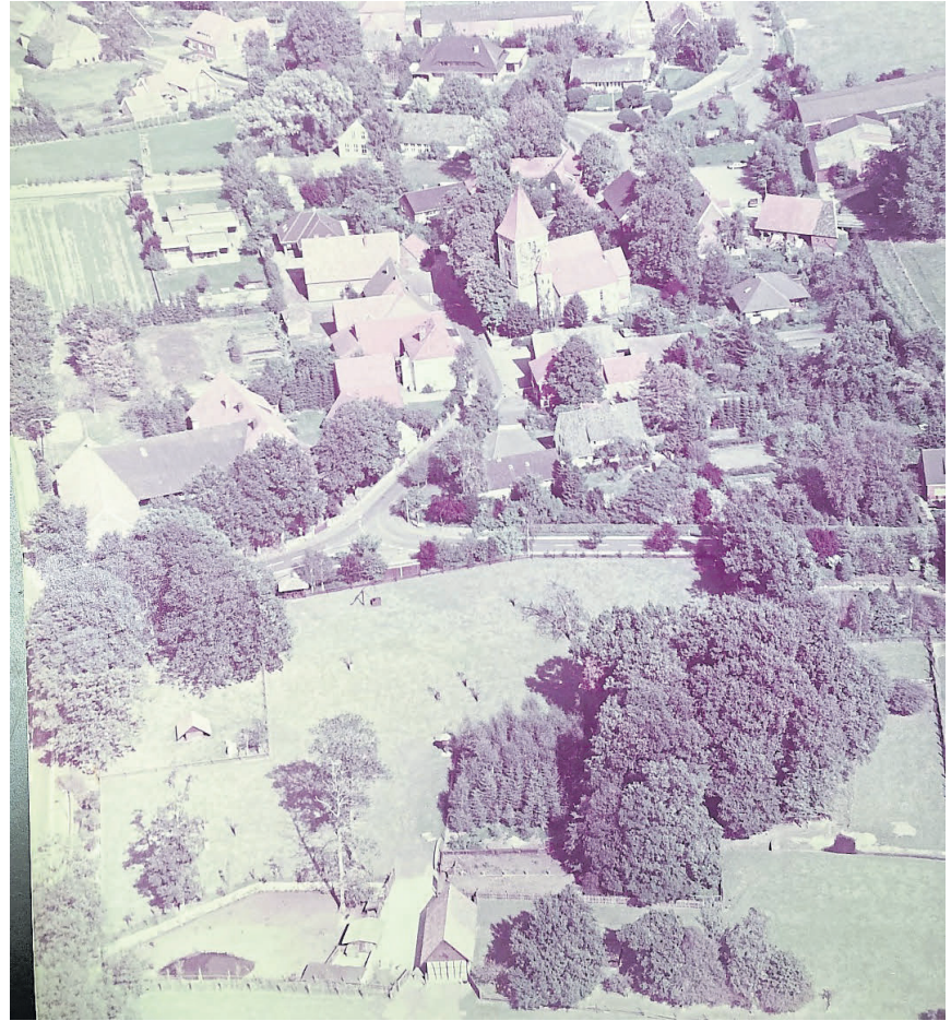
Die Luftbildaufnahme von Schale, aufgenommen vor 50 Jahren, zeigt eindrucksvoll, wie stark der Ortsteil in den letzten Jahrzehnten gewachsen ist.

Wenn auch Sie Fotos von der Entwicklung in Hopsten, Schale und Halverde haben, zeigen Sie uns gerne, wie sich die Ortsteile verändert haben! Schicken Sie uns Fotos und Anekdoten aus der Zeit aus der Gemeindegebietsreform – gerne als Datei an pleie@hopsten.de oder per Post. Am Ende des Jahres möchten wir allen Bewohnerinnen und Bewohnern diese Fotos präsentieren.