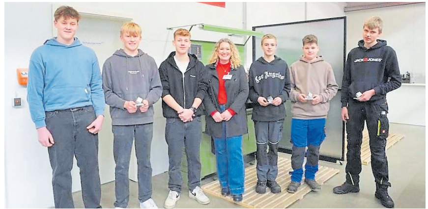
Die St.-Georg-Schüler besuchten drei Betriebe in Hopsten, hier die Firma B&B Verpackungstechnik.

Einige Jugendliche äußerten direkt vor Ort den Wunsch, ein Praktikum oder eine Ausbildung in einem der Betriebe zu beginnen. Auch in