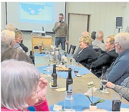
Ein Polizeibeamter klärte Mitglieder des VdK-Ortsverbandes Hopsten/Halverde über Betrugsmaschen auf.