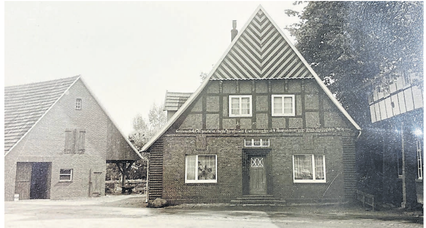
Gaststätte Zur Alten Post (ganz rechts angedeutet) und Wohnhaus am Dorfplatz.