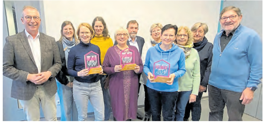
Die Gewinner des Heimatpreises 2024 waren zu einer Feierstunde ins Hopstener Rathaus eingeladen.