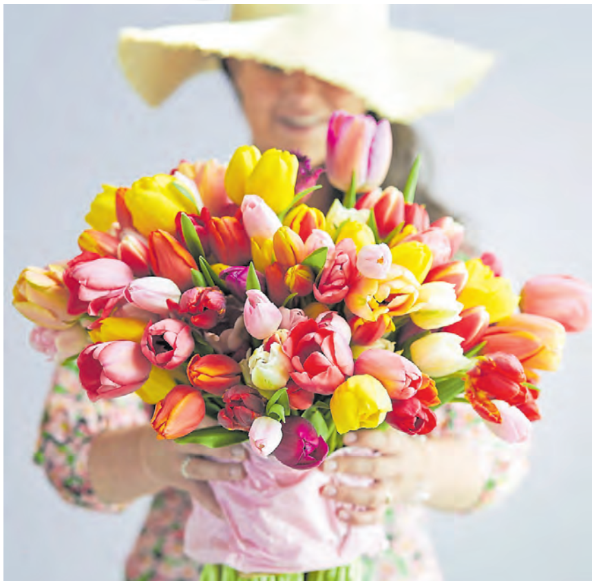
Tulpen sind wahres Farbwunder und in noch weit mehr als nur ein paar Regenbogenfarben erhältlich.

Tatsächlich hätte man mit keiner anderen Pflanze die Rainbow-Allegorie in „Wicked“ so gut umsetzen können, wie mit der Tulpe. Denn die Zwiebelblume ist ein wahres Farbwunder. Dank gezielter Züchtungen gibt es sie heute in fast jedem Ton: Von Dunkelviolett, leuchtend Rot und strahlend Gelb über sanfte Pastelltöne und Weiß bis hin zu mehrfarbig reicht das Sortiment. Und wer nach dem Kino-Besuch Lust auf Farbe und Tulpen hat, muss nicht warten, bis die Schönheiten ab April bei uns wieder in den Gärten blühen. Denn die Saison der Schnitttulpen hat schon begonnen! Überall in Supermärkten, Gartencentern oder beim Floristen findet man sie. Wie das so weit vor Frühlingsbeginn möglich ist? Nun, die Tulpengärtner in den Niederlanden können zwar nicht hexen, aber sie wenden einen Trick an: Bereits im Herbst wird den Zwiebelpflanzen in Kühlkammern durch niedrige Temperaturen ein künstlicher Winter vorgegaukelt. Dann kommen sie ins Gewächshaus, die Temperaturen steigen, und das ist für die Blumen das Signal, mit dem Wachsen zu beginnen und ihre