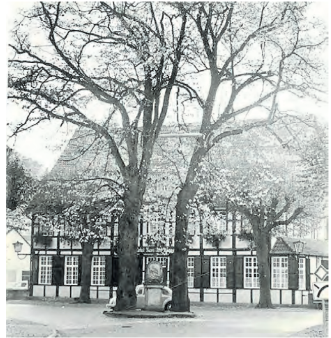
Alte Ansicht der Gaststätte Kerssen-Brons.