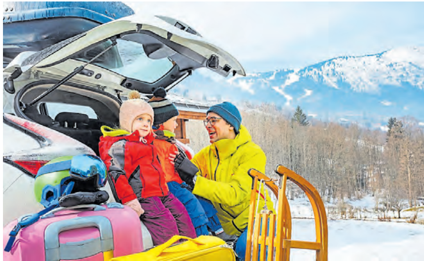
Vollgepackt in den Winterurlaub: Sicherheit steht beim Reisen mit der ganzen Familie an erster Stelle.

■ Winterurlaub beginnt mit guter Vorbereitung: Winterliche Straßenbedingungen wie Schnee und Eis erfordern eine gründliche Vorbereitung des Fahrzeugs. Winterreifen mit mindestens 4 mm Profiltiefe bieten sicheren Grip bei Schnee und Glätte, während die gesetzliche Mindestanforderung von 1,6 mm oft nicht ausreicht. Kalte Temperaturen senken den Reifendruck, daher sind vor der Fahrt eine Kontrolle und gegebenenfalls eine Erhöhung um 0,2 bar über die Herstellerempfehlung sinnvoll. Auch die Batterie sollte geprüft werden, da ihre Kapazität bei Temperaturen unter 0 °C deutlich abnimmt. Zusätzlich empfiehlt sich das Auffüllen der Scheibenwischanlage mit einem Frostschutzmittel, das Temperaturen bis mindestens