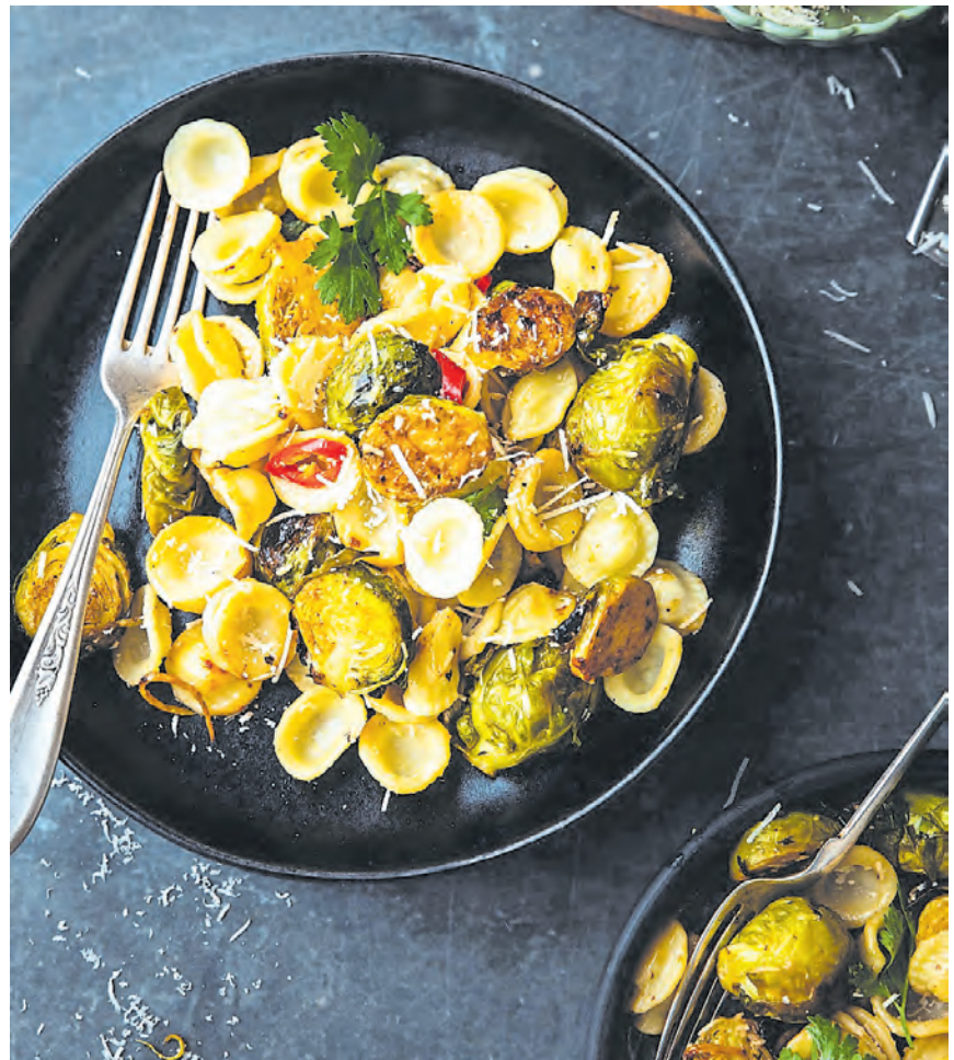
Frischer Rosenkohl aus dem Ofen schmeckt köstlich und passt dann hervorragend zur Pasta.

Ob Chicorée, unterschiedliche Kohlsorten oder milder Spinat: jede Menge Inspiration für vielfältige Geschmackserlebnisse finden sich in der Ideenküche der Initiative „Obst & Gemüse – 1000 gute Gründe“ unter www.1000gutegruende.de . Saisonale Rezepte auf der Website werden ergänzt durch neue Kreationen angesagter Food Blogs auf den Social-Media-Kanälen der Initiative. Auf Instagram und Facebook gibt es gerade zum Jahresbeginn noch mal eine „Extraportion“ aus der köstlichen Gemüseküche zu entdecken. (pd)