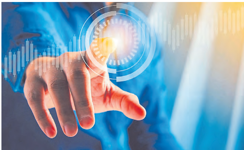
Cyberangriffe sind ein immer größer werdendes Risiko für die IT von Unternehmen.

Mit dem Smartphone, Tablet oder Laptop jederzeit und überall im Internet zu surfen gehört mittlerweile zum Alltag. Die Anzahl der Menschen, die auch von zu Hause arbeiten, ist im Zuge der Corona-Pandemie stark angestiegen – und mit dieser Zahl steigt auch das Risiko für Unternehmen, von Cyberkriminellen attackiert zu werden. Online-Betrüger, Erpresser und Hacker haben es zuletzt vermehrt auf kleine und mittlere Unternehmen abgesehen, denn sie vermuten wenig bis keine Gegenwehr durch professionelle Schutzmaßnahmen. Gleichzeitig ist aber auch bei kleineren Unternehmen für Betrüger aus dem Internet