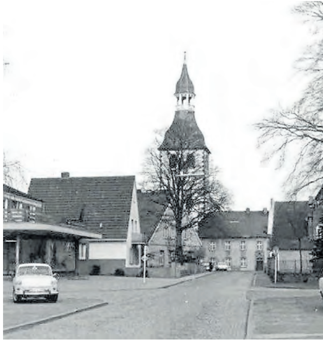
Zufahrt zum Marktplatz (circa 1970).

Hintergrund der Reform: Die Gemeindegebietsreform in NRW 1975 war ein bedeutender Schritt zur Umstrukturierung der kommunalen Landschaft. Ziel war es, leistungsfähigere und zukunftsfähigere Gemeinden zu schaffen. Die Reform